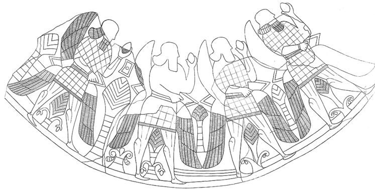
9 Funde aus Olympia, Grabungskampagne Frühjahr 1937: Fries geflügelter Männer (Foto und Umzeichnung: D-DAI-ATH-Olympia 834; D-DAI-ATH-Olympia 4194).