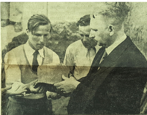
Erster Fund, Reichsminister Rust mit einem korinthischen Bronzehelm, der auf dem Ausgrabungsgelände bereits gefunden wurde.