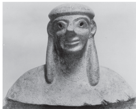
10 Funde aus Olympia, Grabungskampagne Frühjahr 1937: „Assurattaschen“ (Fotos: D-DAI-ATH-Olympia 843; D-DAI-ATH-Olympia 839).

Das Fundgebiet setzt sich nach dem Kronion zu wohl unter die heutige Strasse fort. Es soll in dieser Kampagne nur noch festgestellt werden, ob es jenseits der Strasse und unterhalb des Grabungsgebietes gegen den Stadioneingang zu weitergeht oder ob das Bachbett mit Fundstücken weiter östlich gegen die Stadionbahn zu abbiegt. Ferner soll sofort mit dem Bau eines Ausgrabungshauses und der nötigen Schuppen für die Feldbahn, Gerät und zur Bergung von Funden begonnen werden. Der Bau wird von Regierungsbaumeister Johannes als einzigem z.Z. anwesenden deutschen Architekten ausgeführt werden. Die Feldbahn und das übrige Material sind jetzt durchweg in Patras angekommen, bereits aus der Zollsperrre befreit und sollen nunmehr nach Olympia überführt werden.