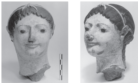
12 Funde aus Olympia 1936/37: Terrakotaköpfchen.

Bei unseren Archivrecherchen in Athen und in Berlin wurden wir von zahlreichen Kollegen unterstützt. Bedanken möchten wir uns ganz besonders bei den Kollegen im DAI Athen (Themis Bilis, Katharina Brandt, Joachim Heiden, Irini Marathaki und Reinhard Senff), in der Zentrale des DAI in Berlin (Jörg Denking) sowie bei unseren Ansprechpartnerinnen im Archiv des DAI Berlin (Johanna Mueller von der Haegen) und im Bundesarchiv, Berlin-Lichterfelde (Simone Langner).