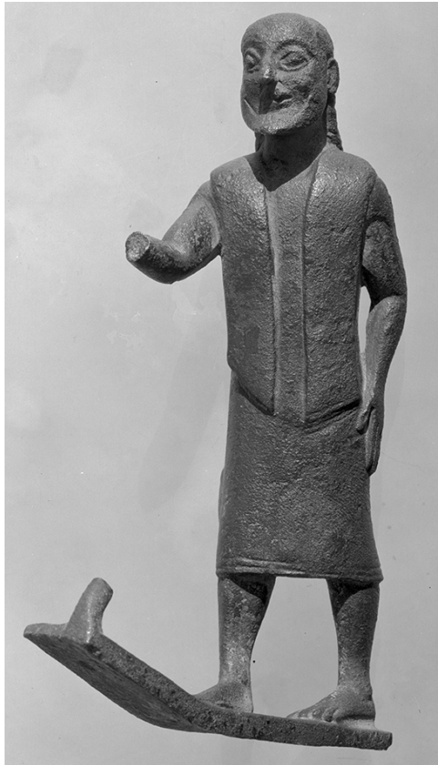
11 Funde aus Olympia 1936/37: Bronzestatuette eines alten Mannes.