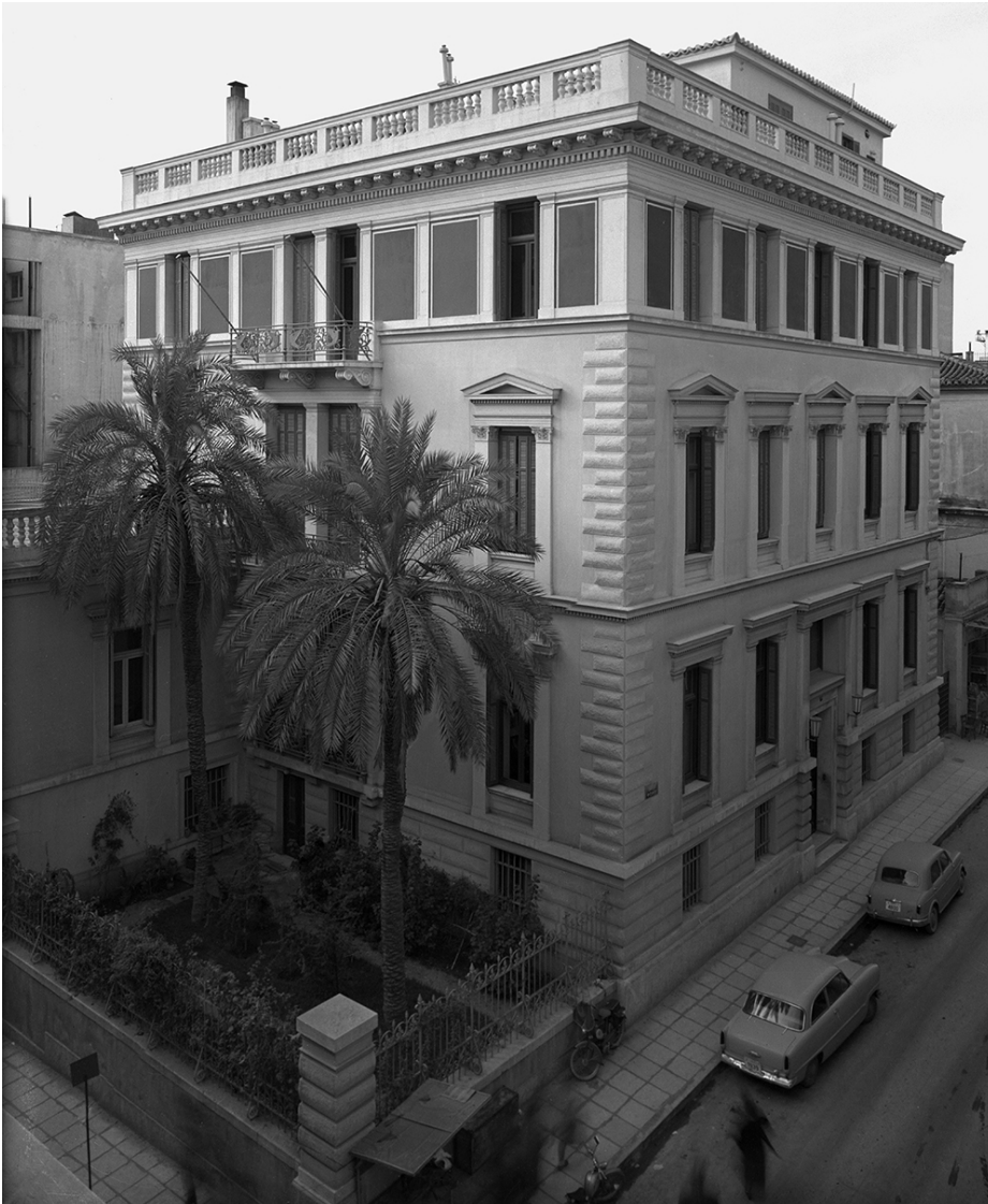
2 Foto des renovierten DAI Athen im Jahr 1956. Vor dem Institutsgebäude stehen ein Ford Taunus Weltkugel und ein Fiat Nuova 1100. Vermutlich handelt es sich um Wagen von Institutsangehörigen.