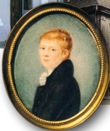
Die Garnisonschule um 1900 | Heinrich von Kleist. Kopie nach der Originalminiatur des Peter Friedel (1801), zwischen 1831 und 1837

Das Kleist-Museum befindet sich in der ehemaligen Garnisonschule, einer Freischule für die Kinder der einfachen Soldaten.