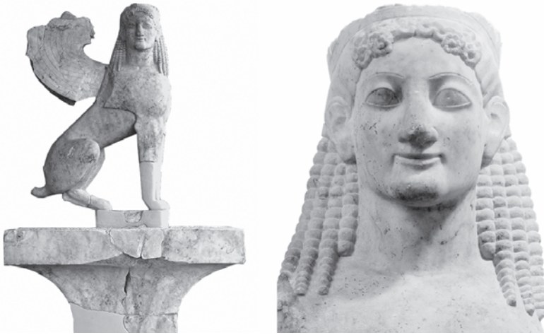
Εικ. 10: Σφίγγα από τον Κεραμεικό

Οι απαλλοτριώσεις πήγαν τελικά κατ' ευχήν: «Στον Κεραμεικό κατεδαφίστηκαν οι οικίες στην οδό Σαλαμίνας, μεταφέρθηκαν τα μπάζα, ενώ είναι διακριτή μια εγκάρσια πλατιά τομή». 89 Σε άλλα σημεία έγιναν μεμονωμένες έρευνες, όπως, για παράδειγμα, στο Πομπείο και την Ιερά Πύλη. Έτσι, το 1942 βρέθηκε η πολύ καλά διατηρημένη μαρμάρινη σφίγγα του 6 ου αι. π.Χ. 90