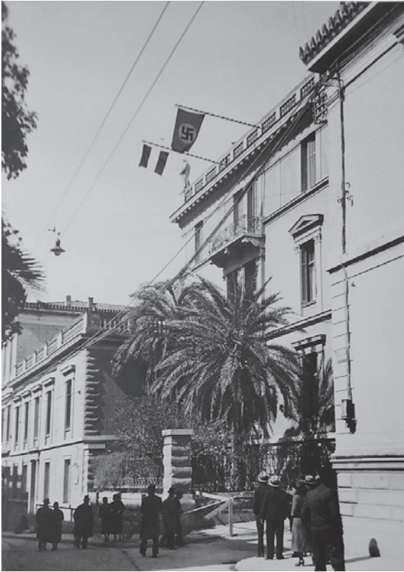
Εικ. 1: Το ΓΑΙ Αθηνών στις 25 Μαρτίου 1933

(Ταχυδρομικό Δελτάριο από το Αρχείο του Εθνικού Ιστορικού Μουσείου Αθηνών, ψηφιοποίηση ΚΖ-ΙΓ 713)