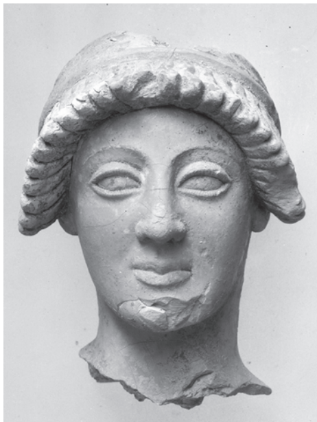
Εικ. 9: Κεφαλή του Γανυμήδη από την Ολυμπία

αποτελούν τα χάλκινα και σιδερένια ευρήματα (κράνη, όπλα, ανάγλυφα μεταλλικά ελάσματα και πόδια τριπόδων). Καθώς αυτά ήταν εξαιρετικά ευαίσθητα και δύσκολα μπορούσαν να ανασυρθούν και να συντηρηθούν, στην ανασκαφή της Ολυμπίας ο συντηρητής, ο σχεδιαστής και ο φωτογράφος διαδραμάτισαν κομβικό ρόλο. Εντυπωσιακό μεμονωμένο εύρημα ήταν το κεφάλι από τερακότα του Γανυμήδη, προερχόμενο από το σύμπλεγμα Δία-Γανυμήδη του 5 ου αιώνα. 86