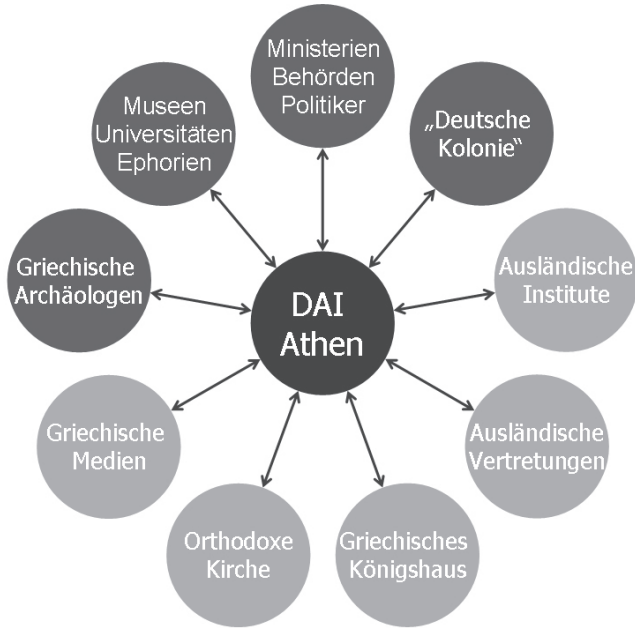
Εικ. 2: Δίκτυα του ΓΑΙ Αθηνών στην Ελλάδα

Ήδη από την ίδρυσή του το 1872 το Γερμανικό Αρχαιολογικό Ινστιτούτο Αθηνών δημιούργησε ένα πυκνό δίκτυο επαφών. Στον στενότερο κύκλο ανήκαν η γερμανική πρεσβεία Αθηνών, οι εκπρόσωποι των γερμανικών Μέσων Ενημέρωσης στην Ελλάδα, τα γερμανικά σχολεία στην Αθήνα και τη Θεσσαλονίκη (DSA και DST), η Γερμανική Ευαγγελική Εκκλησία στην Αθήνα (DEKA), η αντιπροσωπεία του Γερμανικού Εμπορικού Επιμελητηρίου στην Αθήνα (DHK) και ο γερμανικός όμιλος «Φιλαδέλφεια». Το ΓΑΙ Αθηνών ανέπτυξε έντονη επικοινωνία με τα ελληνικά υπουργεία, μουσεία, πανεπιστήμια και εφορείες αρχαιοτήτων. Επιπλέον, υπήρχε επαγγελματική και προσωπική επαφή με τους συναδέλφους των άλλων αλλοδαπών Σχολών/Ινστιτούτων. 18