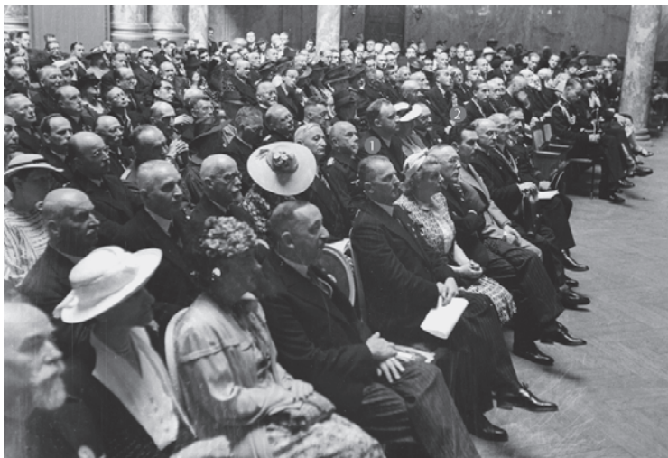
Εικ. 6: Η εκατονταετηρίδα του ΓΑΙ στο Βερολίνο

Παρά την πολιτικά φορτισμένη κατάσταση, οι συμμετέχοντες στο συνέδριο ξεπέρασαν τους 900, μεταξύ αυτών διάσημοι συνάδελφοι από το εξωτερικό και φυσικά σημαντικοί εκπρόσωποι του ΓΑΙ Αθηνών.