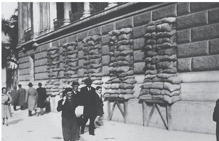
Εικ. 8: Μέτρα ασφαλείας στην Αθήνα το 1940... Το σπίτι του Schliemann στην οδό Πανεπιστημίου

Το 1940 η Ιταλία είχε δημοσίως εγείρει εδαφικές αξιώσεις σε βάρος της Ελλάδας, είτε με επιθετική ρητορική, είτε με μεμονωμένες επιθέσεις. Στις 28 Οκτωβρίου, ο Μουσολίνι απαίτησε την ελεύθερη διέλευση και στρατηγικά σημεία για τα στρατεύματά του στην Ελλάδα. Η απάντηση του δικτάτορα Μεταξά ήταν το περίφημο «ΟΧΙ», που οδήγησε στον ελληνοϊταλικό πόλεμο. Οι συγκρούσεις έλαβαν χώρα τον χειμώνα στα βουνά της Ηπείρου, υπό τις πιο αντίξοες συνθήκες. Οι Ιταλοί ήταν ανεπαρκώς προετοιμασμένοι, έλαβαν λάθος αποφάσεις και γνώρισαν συντριπτική ήττα από τον ελληνικό στρατό που, από τις αρχές Νοεμβρίου, τους απώθησε στο αλβανικό έδαφος, που είχε αποτελέσει το ορμητήριο των ιταλικών δυνάμεων.