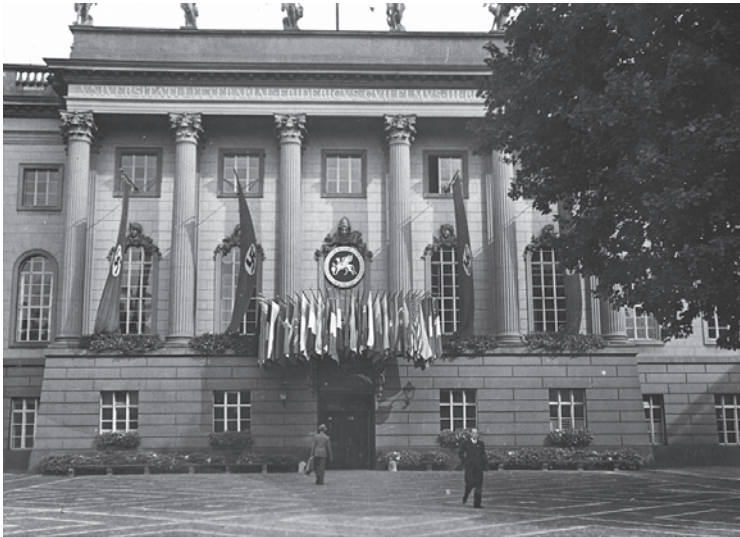
Εικ. 5: Το πανεπιστήμιο Friedrich-Wilhelms τον Αύγουστο 1939 (DAI Berlin, Archiv der Zentrale, Kasten VI, Foto Ströhla)

Το 1938 και 1939 κορυφώνονταν στο Βερολίνο οι προετοιμασίες για το μεγάλο διεθνές αρχαιολογικό συνέδριο, 64 το οποίο πραγματοποιήθηκε στο πανεπιστήμιο Friedrich-Wilhelms (το σημερινό πανεπιστήμιο Humboldt), τον Αύγουστο του 1939, λίγο πριν από την έναρξη του Β΄ Παγκοσμίου Πολέμου. Πάνω από την είσοδο υπήρχε ο θυρεός του ΓΑΙ, 65 πλασιωμένος από σβάστικες.