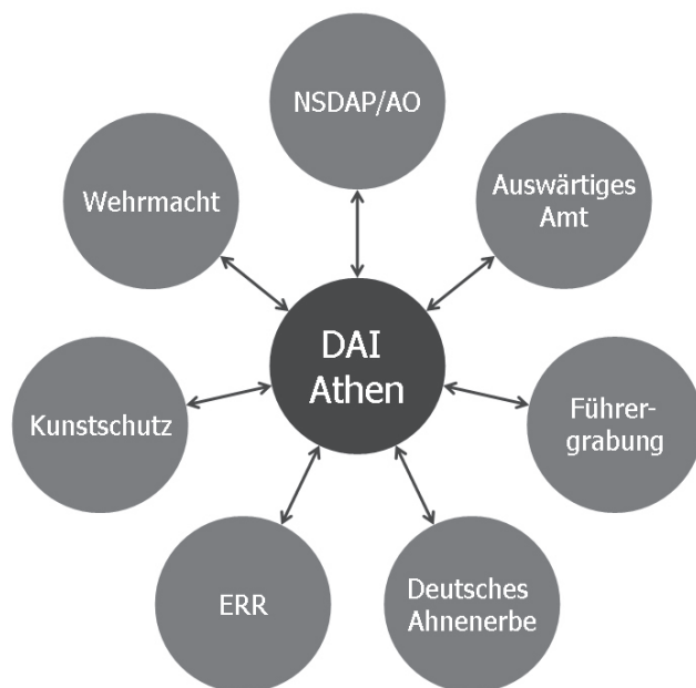
Εικ. 3: Δίκτυα και αντιπαλότητες – Διοικητικό χάος στο Γ' Ράιχ

Ο «μακρύς» ελληνογερμανικός εικοστός αιώνας: Οι μαύρες σκιές στην ιστορία των διμερών σχέσεων