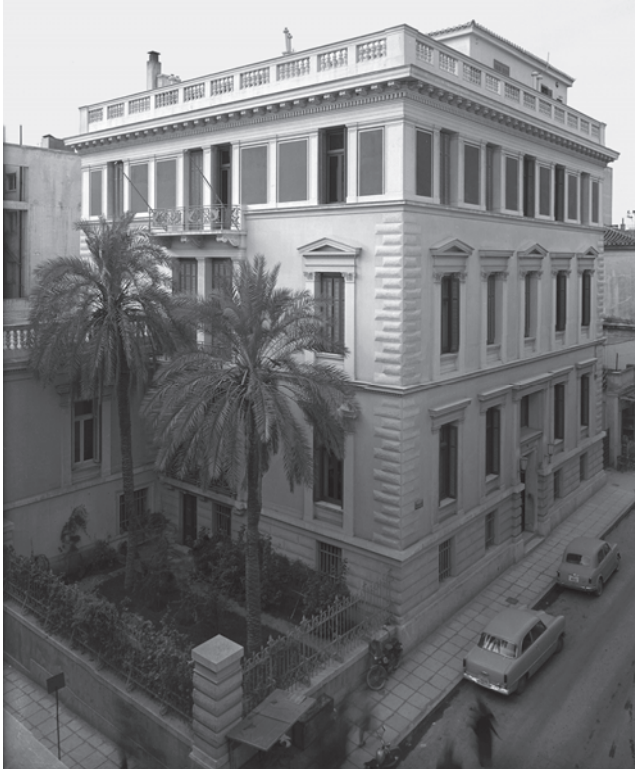
Εικ. 11: Το κτήριο του ΓΑΙ Αθηνών το 1956

Οι προσπάθειες όλων των εμπλεκόμενων μερών οδήγησαν τελικά στο επιθυμητό αποτέλεσμα και το ΓΑΙ άνοιξε τελικά τις πύλες του τον Δεκέμβριο του 1951. 104