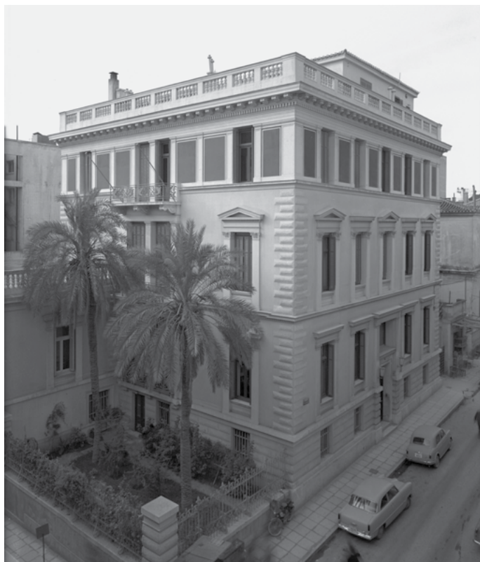
2 DAI Athen, Gebäude 1956 nach umfang- reichen Restaurie- rungsarbeiten | DAI Athen, το κτήριο το 1956, ύστερα από εκτεταμένες εργασίες αποκατάστασης